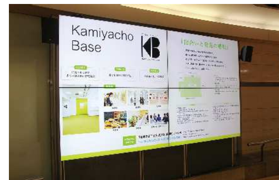
このパンフレットは広島市商店街振興事業により作製されています

静止画だけでなく、スライドショーやテロップ、アニメーションや動画、音声や音楽など様々なコンテンツを配信することができます。