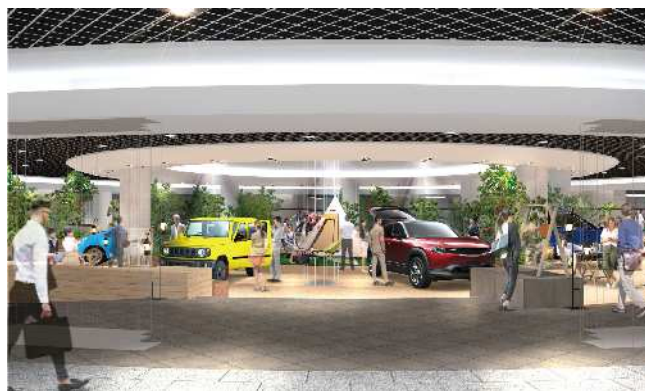
※車両搬入口を新設し、車両展示もできるようになりました。