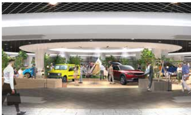
※車両搬入口を新設し、車両展示もできるようになりました。