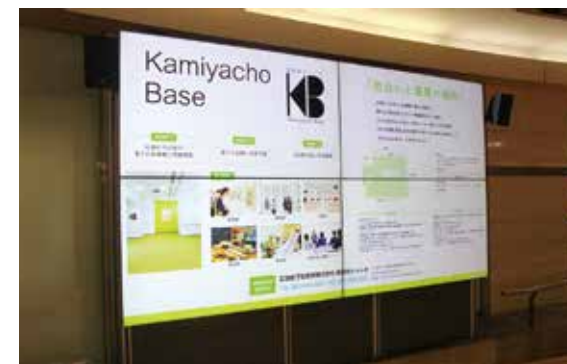
このパンフレットは広島市商店街振興事業により作製されています。

静止画だけでなく、スライドショーやテロップ、アニメーションや動画、音声や音楽など様々なコンテンツを配信することができます。